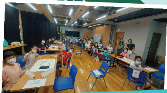
比賽反應熱烈，完成比賽後參加者合照留念