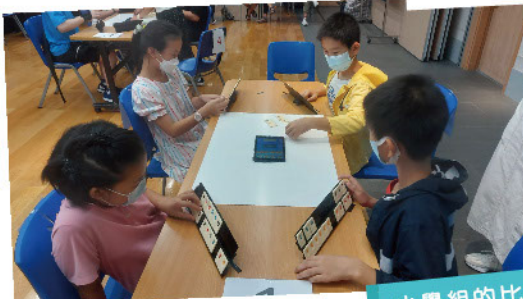
小學組的比賽情形