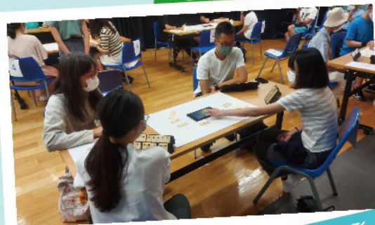
公開組的比賽情形